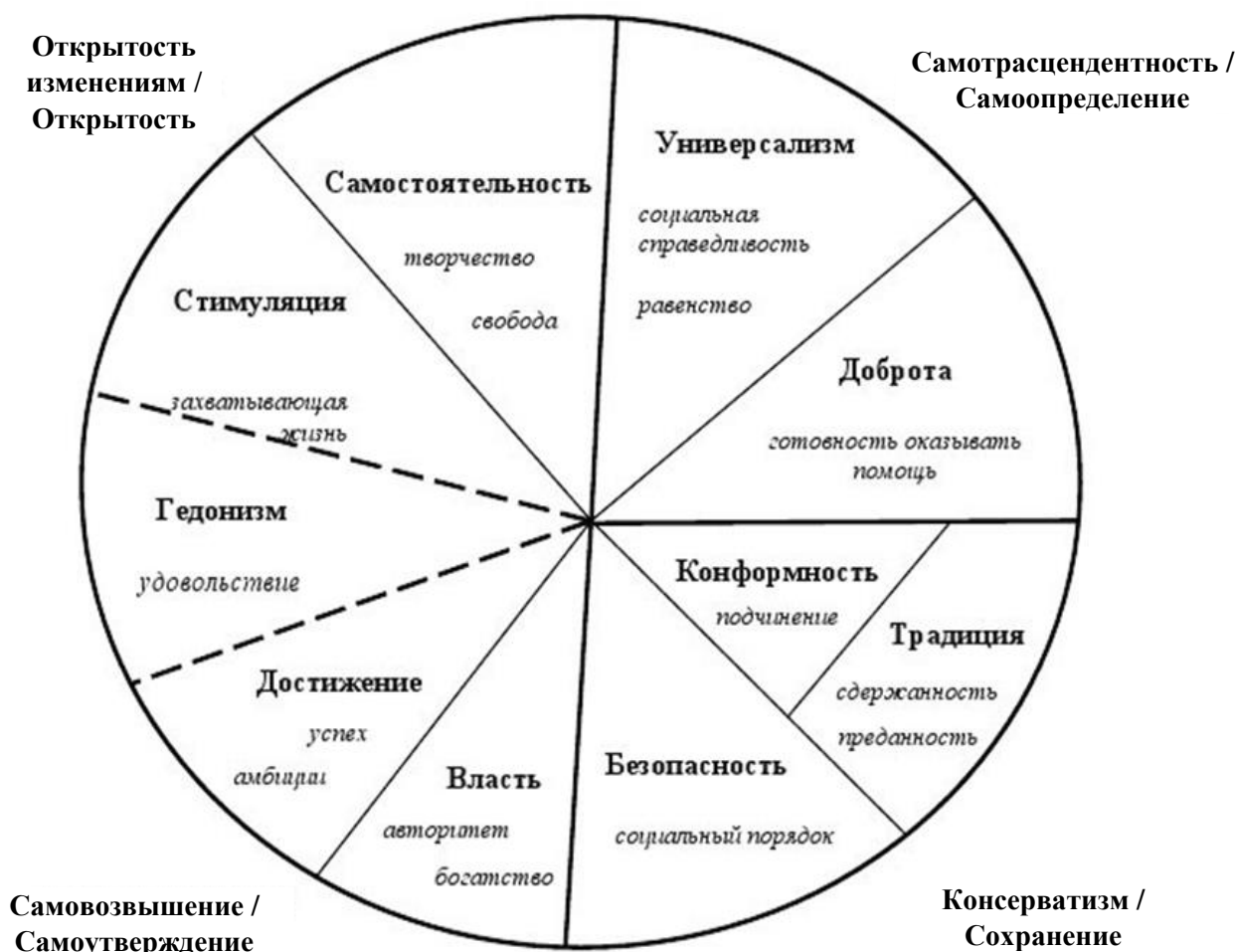
Рис. 1. Модель ценностей по методике Ш. Шварца

Ценности «самоопределения» обнаруживают такую позицию человека, в которой преодолеваются исключительно личные интересы через чувство долга, понимание, заботу о других (рис. 1).